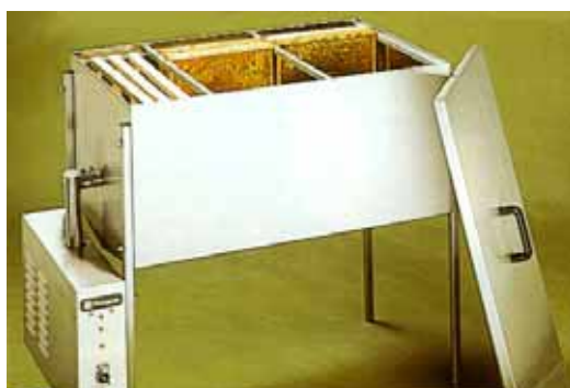
Schweizerisches Zentrum für Bienenforschung (1999)